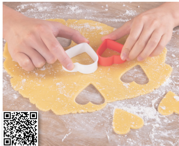
掃描瀏覽產品網頁

有關完整受保手術表，請參閱保單合約內的手術表 7 或瀏覽 https://www.axa.com.hk/zh/surgicare-surgical-insurance-plan 。