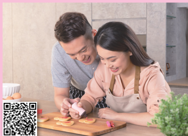
掃描觀看產品短片