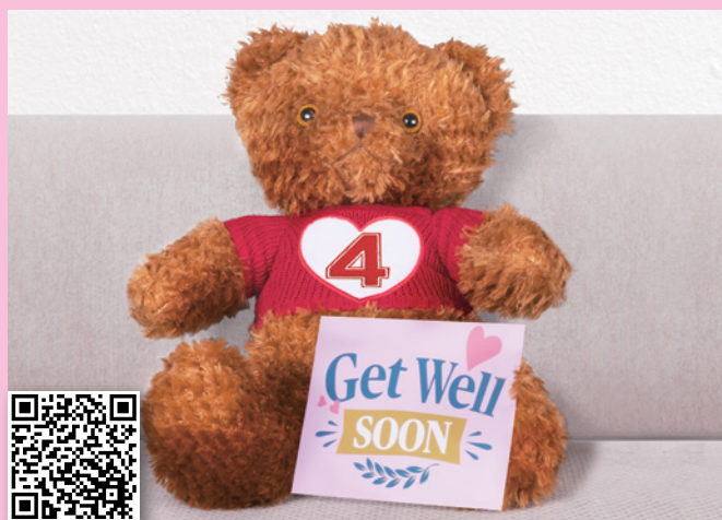
掃描觀看產品短片