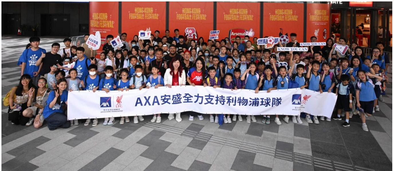
(圖 7)：AXA 安盛作為「香港足球盛會 2025」的鑽石贊助商，與聖雅各福群會及香港明愛攜手合作，向本地基層兒童及家庭送出逾 100 張於 7 月 24 日舉行的利物浦公開訓練門票，讓他們有機會與利物浦球迷及球員一同進行熱身活動。