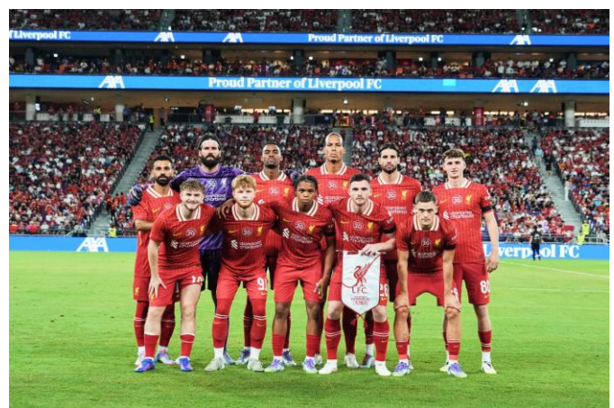
(圖 8-9)：利物浦於 7 月 24 日在啟德體育園主場館舉行公開訓練，為 7 月 26 日在「香港足球盛會 2025」對陣 AC 米蘭的賽事作賽前準備。