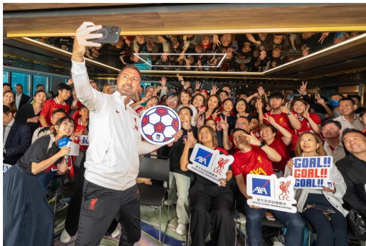
(圖 1)：利物浦球員及名宿獨家見面會於 7 月 22 日舉行，員工和嘉賓與一線球員和球隊名宿互動交流。